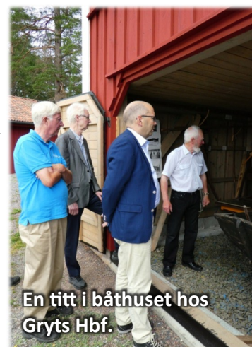
En titt i båthuset hos Gryts Hbf.