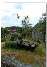
Utsikt från skärgårdsmuseet i Tyrislöt, Sankt Anna.