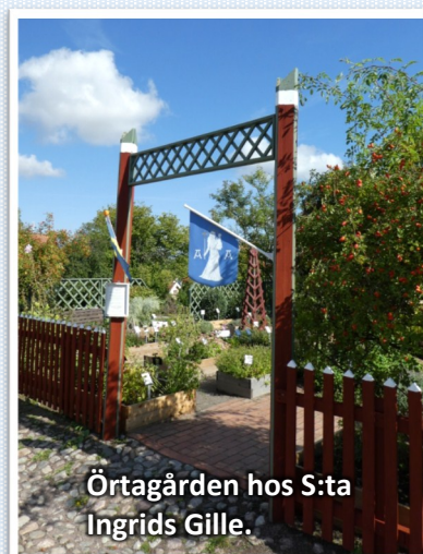
Örtagården hos S:ta Ingrid Gille.

Priset delades ut på Linköpings slott den 5 september inför Östgötadagarna-helgen. Där delades det även ut priser för Det östgötska konsthantverket 2019 samt Årets Östgötadagsbakverk. Läs mer på denna länk: